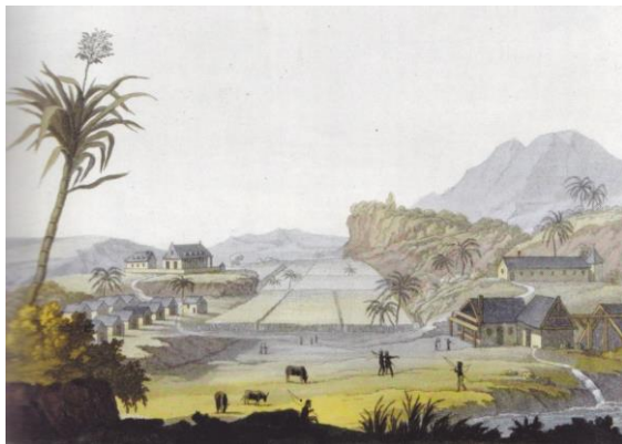
Doc. 7: Une plantation au XVIIIe siècle.

Ce dessin, copie colorisée d'une planche de l'Encyclopédie (XVIIIe), illustre la définition de plantation. Au loin, la maison du maître. En contrebas, les « cases à Nègres », alignées le long de rues. Au centre, l'espace réservé au pâturage. Les champs de canne à sucre occupent les terres les plus riches. A droite, les constructions nécessaires à la transformation de la canne: le moulin à eau, la sucrerie, la gouttière raccordant le canal au moulin, la "purgerie" où l'on fait rendre au sucre son sirop superflu, et une étuve pour faire sécher les pains de sucre. (D'après l' Histoire , n°353).