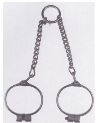
Doc. 6: Entrave en fer . Utilisée pour la traite des Noirs, elle porte la marque DAC (Da Costa) fabricant des chaînes et instruments de traite à Nantes au XVIIIe siècle.

Doc 1 : L'esclave O. Equiano raconte sa traversée : « Je compris que nous devions être transportés au pays des hommes blancs pour travailler pour eux. Nous étions entassés dans les cales du navire. Nous étouffions presque du fait de l'étroitesse de l'endroit, de la chaleur et de l'encombrement de monde où chacun avait à peine l'espace pour se retourner. Cela généra des odeurs répugnantes. Ces conditions provoquèrent des maladies parmi les esclaves dont plusieurs moururent. Cette situation misérable était encore aggravée par le bruit irritant des chaînes, devenues insupportables, et la crasse des latrines. Les cris des femmes et les gémissements des personnes mourantes rendaient toute la scène atroce. [...] Je tombais si faible et malade que je n'avais plus la force de manger, espérant que la mort vint me délivrer. Mais deux hommes blancs m'apportèrent des aliments. Et parce que je refusais de manger, ils l'empoignèrent fermement, m'allongèrent et me fouettèrent sévèrement. » Olaudah Equiano, Ma véridique histoire, 1789