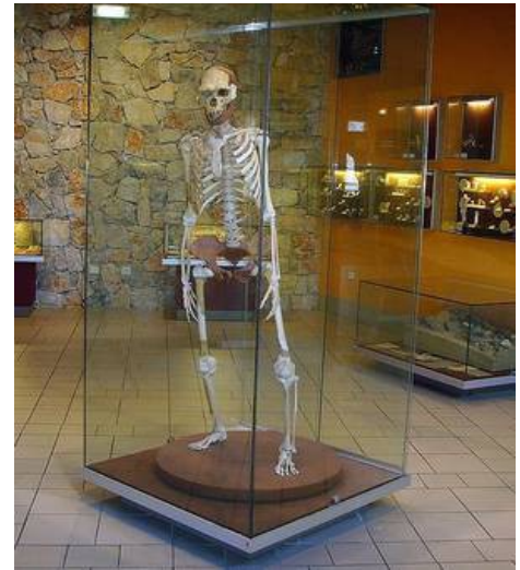
Squelette de l'homme de Tautavel