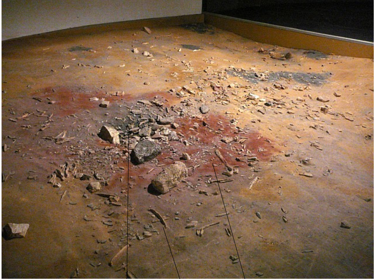
Foyer (espace aménagé pour faire un feu) - os de rennes - Eclats de silex

Vous revenez de Pincevent vous ramenez de vos fouilles des clichés de vos découvertes, à partir de celle-ci, que peut-on apprendre sur les hommes à l'époque du paléolithique et sur leur vie ?