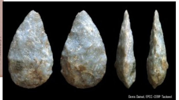
Silex et crane de cerf