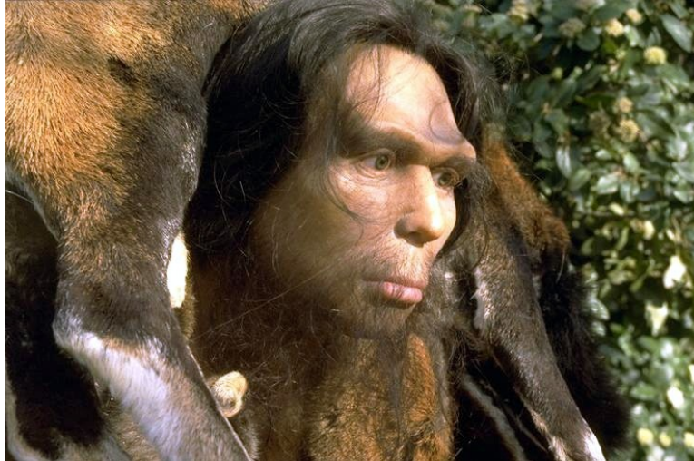
Reconstitution du visage de l'homme de Tautavel (-450 000)

Vous revenez de la Grotte de Tautavel, vous ramenez de vos fouilles des clichés de vos découvertes, à partir de celle-ci, que peut-on apprendre sur les hommes à l'époque du paléolithique et sur leur vie ?