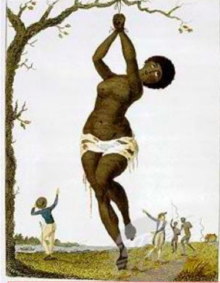
William Blake, Une esclave enduite de miel et recouverte de fourmis rouges, estampes, Musée du Nouveau monde, La Rochelle.

D'après BS FROSSARD, La cause des esclaves nègres et des habitants de la Guinée porté au tribunal de la Justice, de la religion, de la politique, Lyon, tome 1, 1788, chapitre 6 : « travaux auxquels on les soumet »