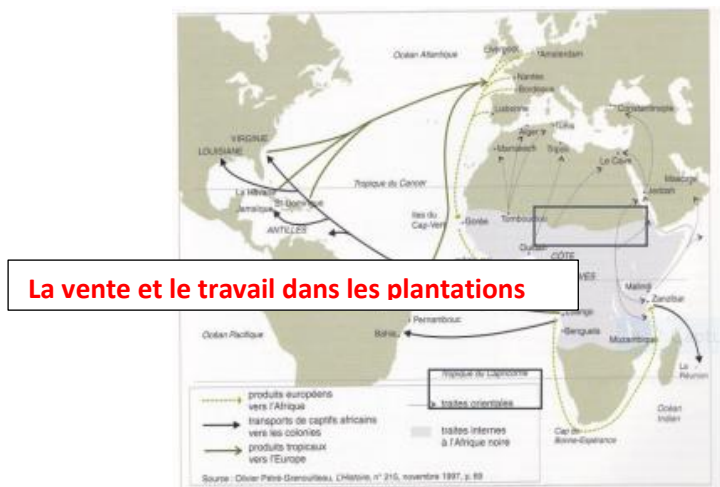
Doc. 1 : Le commerce triangulaire au XVIIIe siècle.

1) Localisez l'étape sur laquelle vous travaillez dans l'encadré qui convient sur la carte.